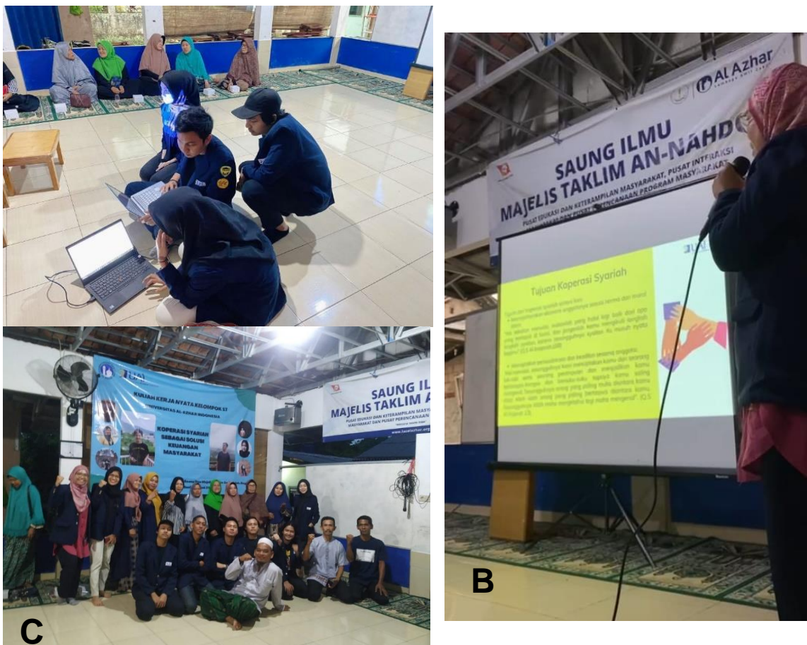
Gambar 2. Sosialisasi koperasi syariah dan bahaya riba: (A) Persiapan; (B) Pelaksanaan sosialisasi koperasi syariah dan riba; dan (C) Foto Bersama

Hasil yang diperoleh setelah kegiatan ini yaitu para anggota koperasi terlihat bersemangat kembali dalam menjadi anggota koperasi syariah, hingga berencana untuk mengajak saudara, keluarga bahkan tetangga yang belum pernah menjadi anggota atau yang sudah keluar dari anggota untuk tidak menggunakan 'Bank keliling' atau renternir lagi mengingat bahaya akan riba sangat masive.