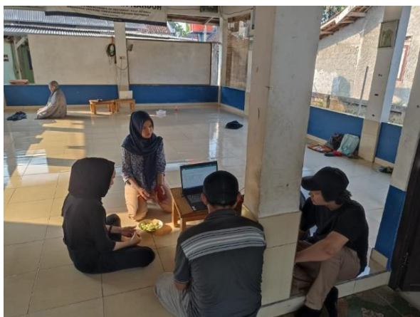
Gambar 4. Pelaksanaan pelatihan sistem pembukuan keuangan Koperasi Syariah