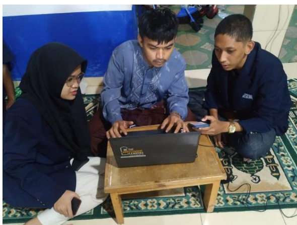
Gambar 3. Pelatihan dasar-dasar Microsoft Excel dan Microsoft Word

hadir setiap kali kami melakukan pelatihan. Keberadaan bendahara tentu sangat penting karena data-data keuangan yang lengkap berada di bendahara koperasi. Sedangkan sekretaris umumnya hanya mencatat di buku administrasi.